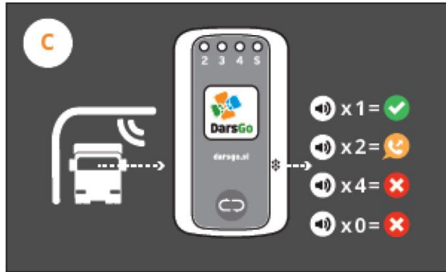
Slika 3: Signali naprave DarsGo ob vožnjah vozil skozi točke cestninjenja