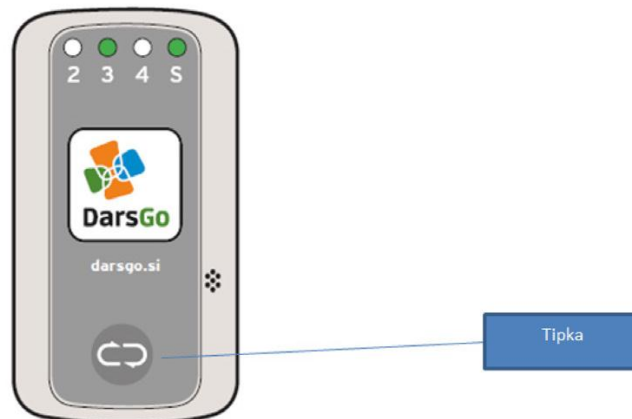
Slika 2: Naprava DarsGo

Za uporabo sistema DarsGo je obvezna uporaba naprave DarsGo. Naprava DarsGo je last družbe DARS, d. d., in je stranki dana v uporabo. Naprava DarsGo je prikazana na sliki 2.