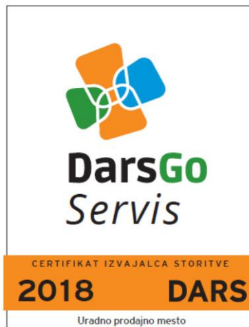
Slika 1: Certifikat DarsGo servisa

Lokacije DarsGo servisov so objavljene na spletnem portalu www.darsgo.si . DarsGo servisi so na vseh lokacijah označeni z enotno oznako, ki je prikazana na sliki 1.