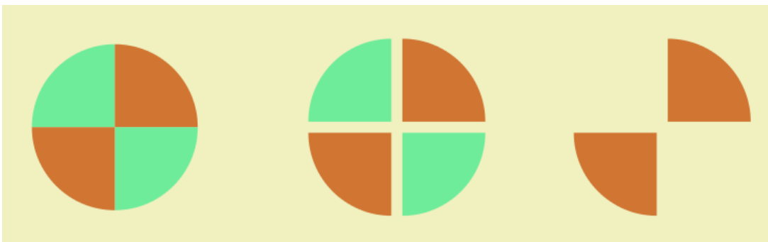
Slika 1: Grafični prikaz metode mešanja in deljenja vzorca s četrтinjenjem

Zbirni vzorec odpadkov je treba s postopkom deljenja vzorca na čedalje manjše dele zmanjševati tako dolgo, dokler se ne pridobi reprezentativni vzorec. To se naredi tako, da se zbirni vzorec razgrne na ravno, utrjeno in za tekočine neprepustno površino. Odpadki se stresejo na kup in se oblikujejo v stožec, nato pa se ta stožec s tako imenovano metodo mešanja in deljenja vzorca s četrтинjenjem po sredini razdeli na štiri približno enake dele. Dve nasprotni četrтini se odstranita, preostali dve pa se združita in zmešata. Znova se naredi stožec. Postopek se ponavlja tako dolgo, dokler preostali četrтini ne ustrežata količini mešanega komunalnega odpadka v reprezentativnem vzorcu.